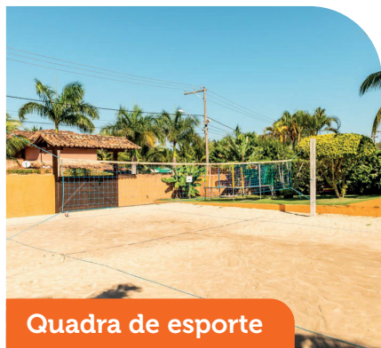
Quadra de esporte